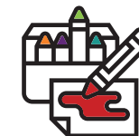
Crayolas de colores