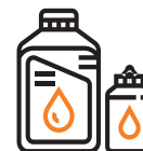
Goma líquida pequeña