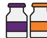
Témperas tipo escolar de dedo