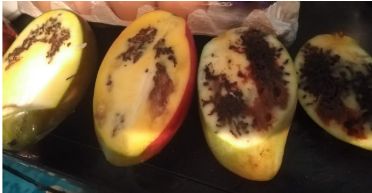
Imagen N°7 Frutas dañadas

26 de julio del 2023 DNCC-AI-SA-005-2023