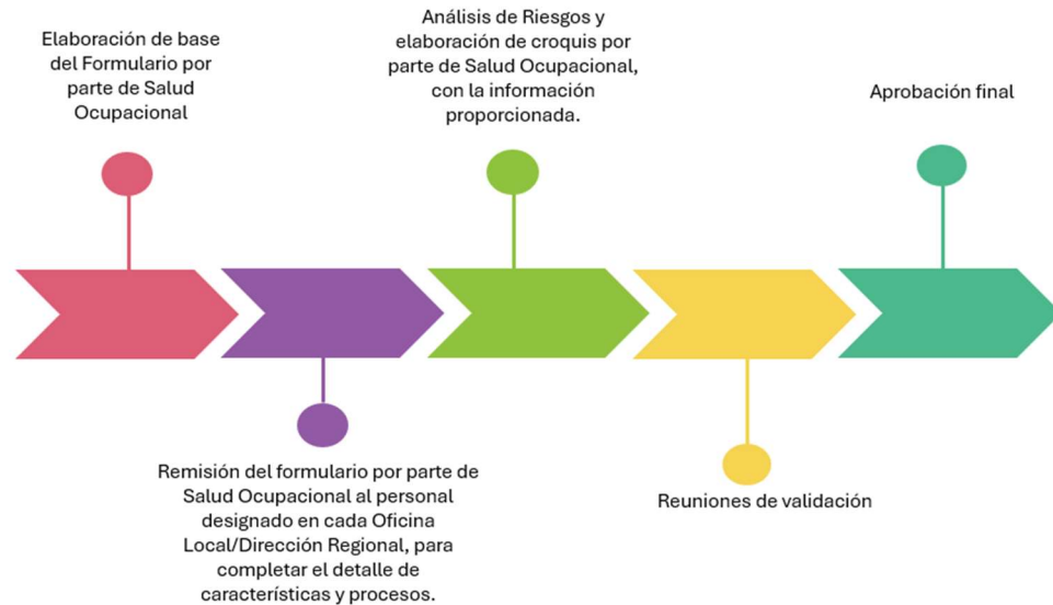
Figura 2. Diagrama para elaboración de los Planes de Preparativos y Respuesta ante Emergencias